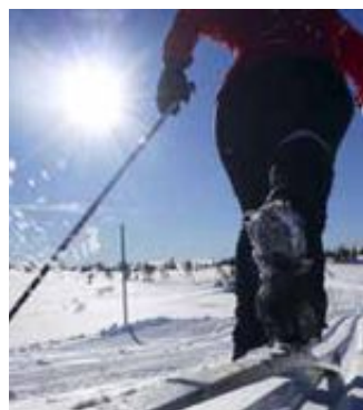
FØRE I FARE: Grå, slapsete vinter vil ta over for den gode, gamle vinteren.