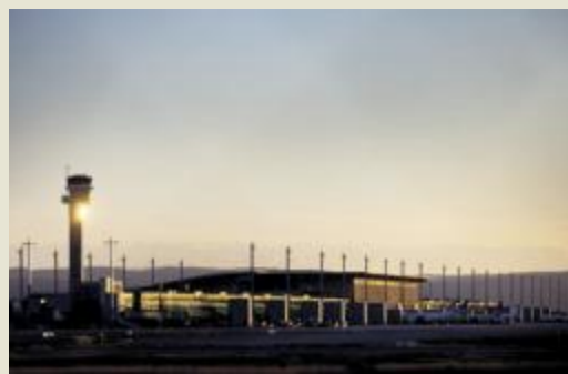
Gardermoen lufthavn ble stanset i en halv time torsdag på grunn av et uidentifisert objekt.

- INGEN SEILFLY ■ Norges Luftsportforbund har sjekket alle aktuelle seilfly i Norge, og ingen av dem var i aktivitet torsdag da trafikken over Gardermoen ble stanset i halvannen time av et uidentifisert objekt. Avinor er i ferd med å undersøke saken videre. Stengningen og forsinkelsene kostet flere millioner kroner.